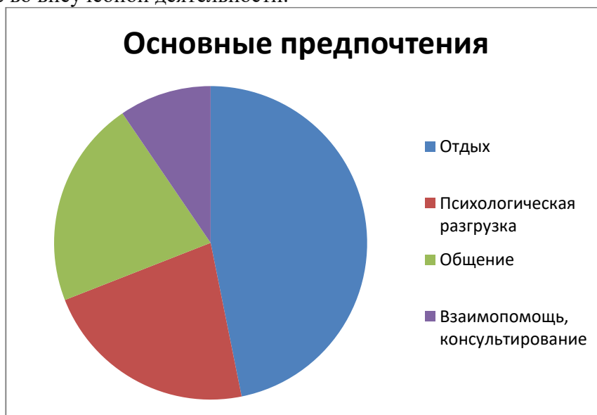
Рис. 2 Мнение респондентов, касающееся предназначения данной комнаты

Основным предназначением данной комнаты 45,7% опрошенных студентов считают отдых, 21,7% – психологическую разгрузку, 20,9% – общение, 9,3% – взаимопомощь, консультирование во внеучебной деятельности.