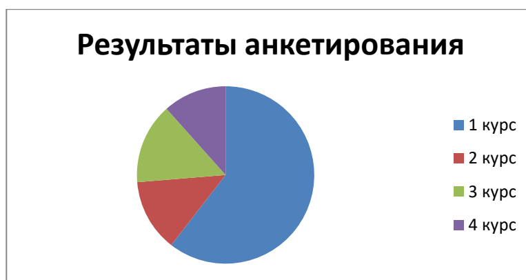
Рис. 1 Распределение респондентов по курсам обучения

В результате опроса было выявлено, что во внеучебное время студенты проводят время на улице (38%), в комнате, которой он проживает (24,8 %) либо играет в компьютерные игры (31%).