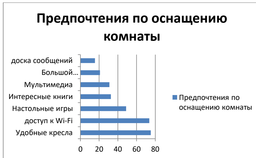
Рис. 3 Ответы респондентов относительно оснащения комнаты

Наиболее интересными мероприятиями, которые могут проводиться в этой комнате, студенты считают: