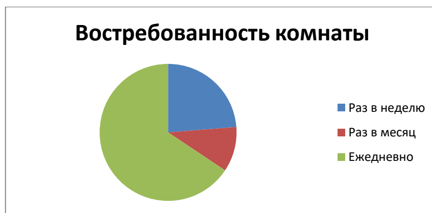
Рис. 5 Мнение респондентов о частоте посещения данной комнаты

Таким образом, исследование показало, что проект комнаты отдыха для студентов весьма актуален в нашем учебном заведении. Реализация проекта позволит решить наиболее значимые проблемы студенческой жизни: обеспечит снятие психологического напряжения, а также организует полноценный разноплановый досуг во внеучебное время взамен бесцельному времяпрепровождению, что на сегодняшний день так важно для подростков с одной стороны и учебного заведения с другой стороны.